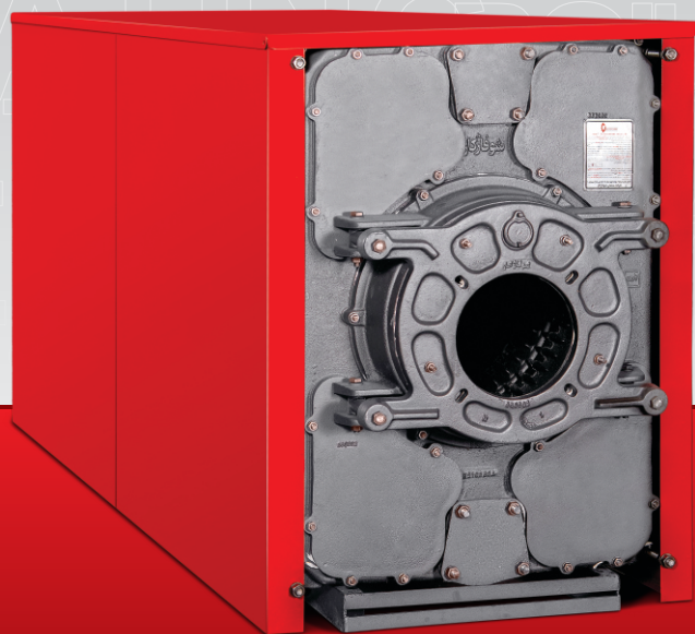
دیگ‌های چدنی ۱۳۰۰

دیگ‌های ۱۳۰۰ به صورت پره پره می‌باشند که قابلیت حمل از طریق آسانسور یا راه پله به محل نصب را دارد و خریدار کمترین نیاز به جرتقیل جهت نصب محصول خواهد داشت.