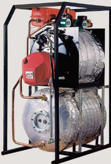
پکیج شوفاژ زمینی ایران رادیاتور